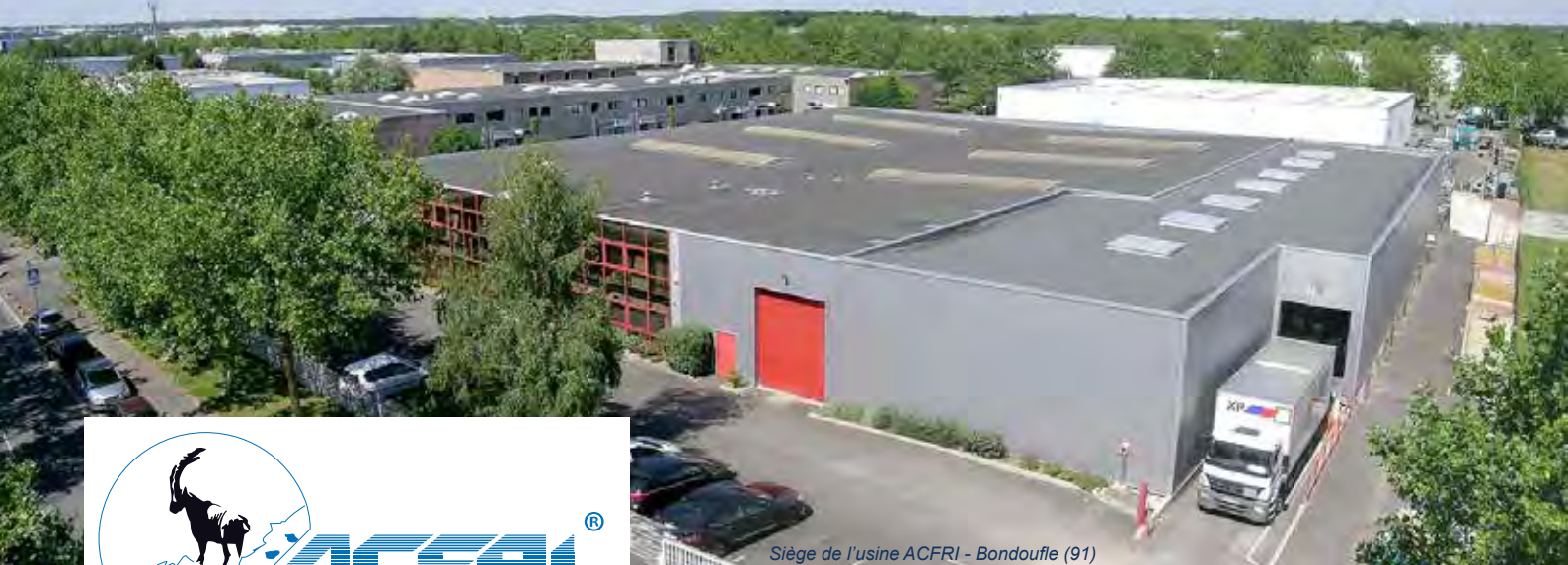
Siège de l'usine ACFRI - Bondoufle (91)